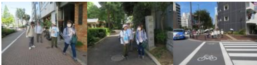
※中野坂上駅への路

②10時45分、氷川神社前で本日の安全を祈願する。10時58分、中野東中学校前を通過する。中野坂上駅には11時6分に到着する。交差点には交番があった。念のため、交通整理していた婦人警官に西新宿五丁目駅への道筋をお伺いする。また、食事する箇所もお伺いする。「直進でOKです。この界限であれば、近くにファミリーレストランがありますが、西新宿五丁目界限ではわかりません」の回答を頂く。お礼を言って、西新宿五丁目駅を目指す。