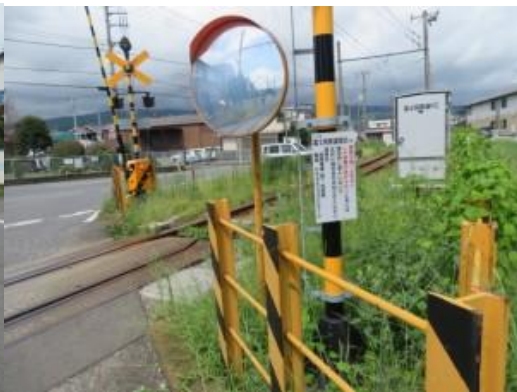
※岳南富士岡駅への路