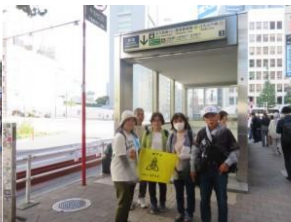
※新宿駅への路、新宿駅