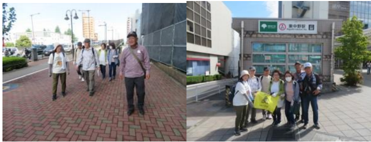
※中井駅への路、東中野駅

②10時45分、氷川神社前で本日の安全を祈願する。10時58分、中野東中学校前を通過する。中野坂上駅には11時6分に到着する。交差点には交番があった。念のため、交通整理していた婦人警官に西新宿五丁目駅への道筋をお伺いする。また、食事する箇所もお伺いする。「直進でOKです。この界限であれば、近くにファミリーレストランがありますが、西新宿五丁目界限ではわかりません」の回答を頂く。お礼を言って、西新宿五丁目駅を目指す。