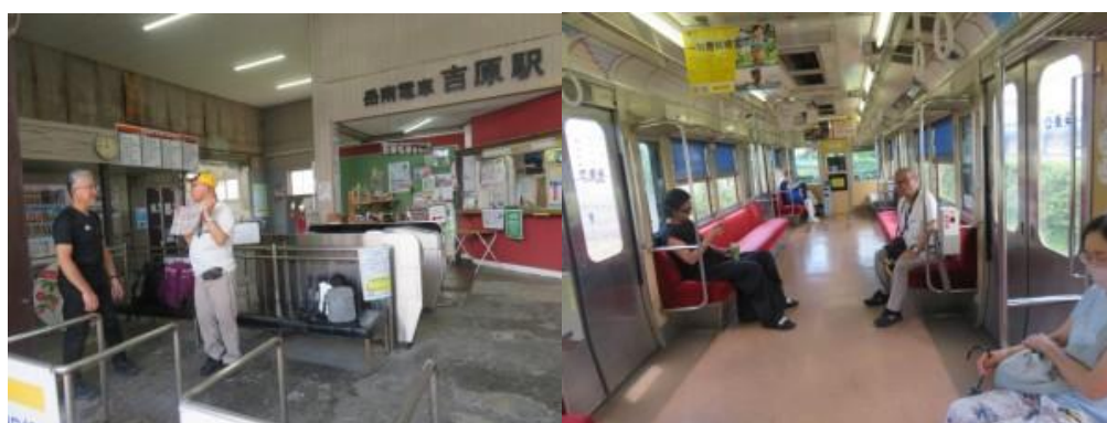
※吉原駅から岳南江尾駅へ