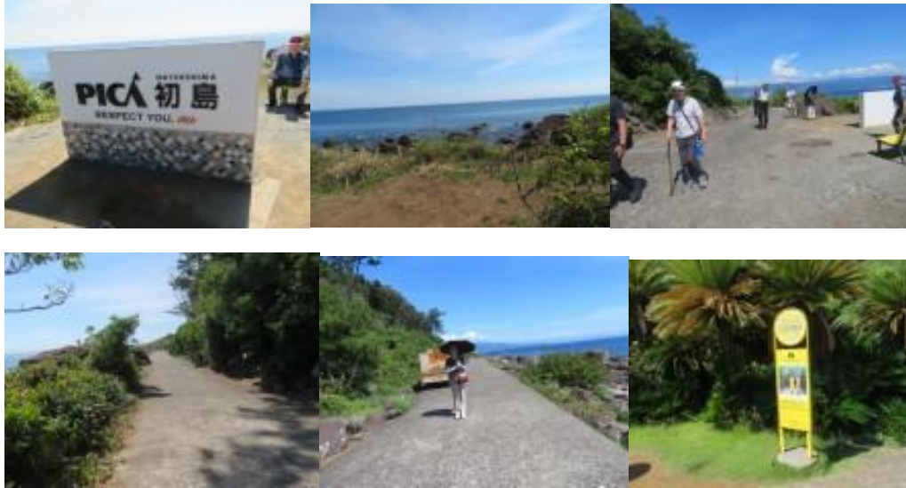
※黄色いポストまでの路