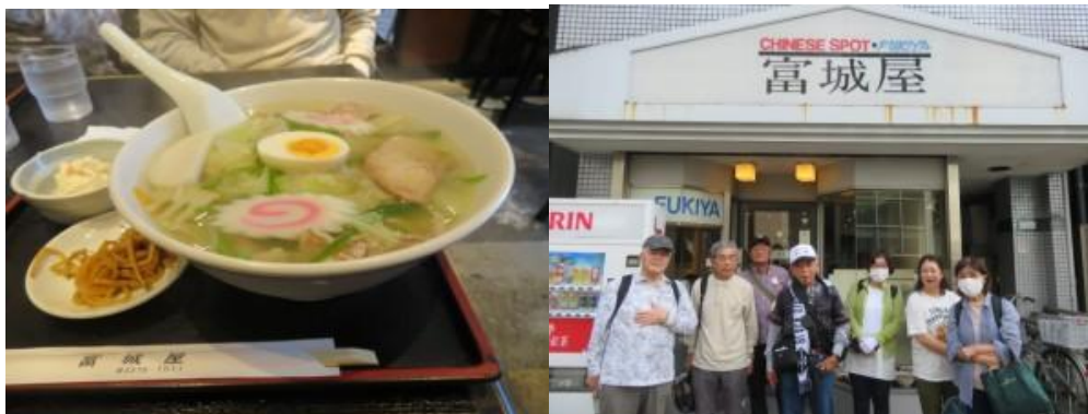
※富城屋でランチタイム

④途中、カニ道楽の店があったので、値段を確認するためにお邪魔する。想定通りランチとしては高い価格であったのでパスする。ここから少し歩いた先に、手頃な中華料理の店（富城屋）があったので、この店に入ることにする。運よく、12 時前に入ったので、7 人が一堂に会してランチがとれる。皆さんに意見を聞いて、全員五目ラーメンとする。ランチ時間を利用して、本日参加頂いたお礼とわいわい道中記 100 回記念号に記載するメッセージを改めて依頼する。加えて、私の鉄道つたい歩きに関し、昨日 AI で描いたイラスト 5 枚をお見せし、どのイラストが一番良いかお伺いする。各自、意見が異なる。最終的には、反省会の席で決めることにする。そのようなことを話し合いしているうちに、ランチタイムは過ぎ去る。12 時 20 分、富城屋前で記念写真を撮影後、トイレ休憩も兼ね都庁を目指す。熊野神社（12 時 25 分）、都庁を経由し、都庁前駅には 12 時 47 分に到着。