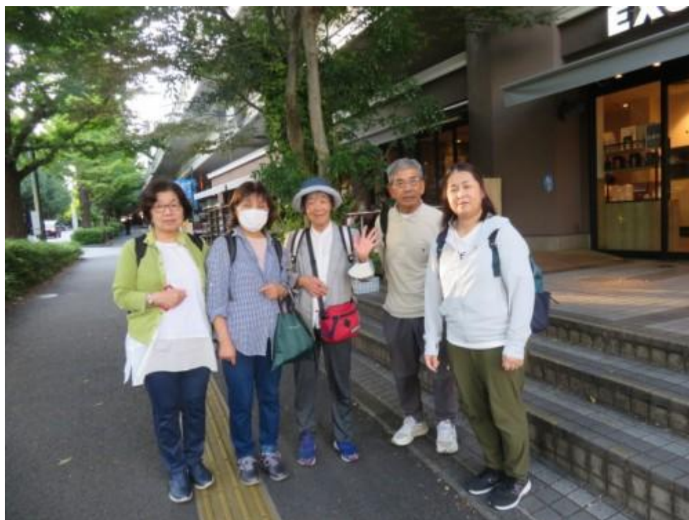
※喫茶店での反省会を終えて